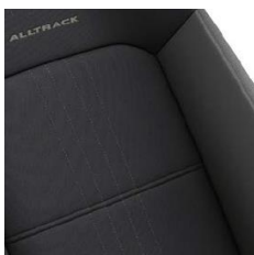
Тканевая обивка сидений "Alltrack"